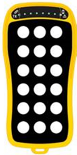
Max. konfiguráció 18 nyomógomb 6 visszajelző LED

– Maximum 18 nyomógomb és 6 visszajelző LED